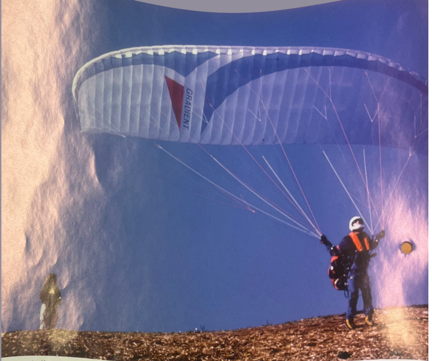
Alles unter Kontrolle: Idealer Startplatz am Zwölfher mit Ausrichtung nach Nordosten