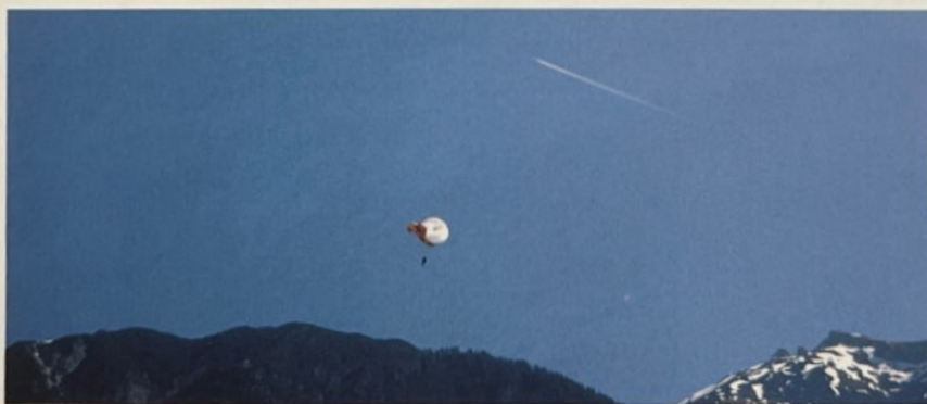
Eiskaltes Wasser empfängt den einzig Mutigen, der Anfang Mai freiwillig die Rettung wirft.

wichtig, aber vor allen Dingen soll es Spaß machen! Ich möchte, dass die Leute, die von hier weggehen, einerseits was gelernt haben und andererseits eine gute Zeit hatten. Es soll nicht ein Gefühl vergleichbar dem „Oh, ich müsste mal wieder zum Zahnarzt!“ aufkommen, sondern es soll mehr so sein: „Hey, ich darf mal wieder zum Sicherheitstraining“.